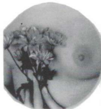
Cáncer de mama