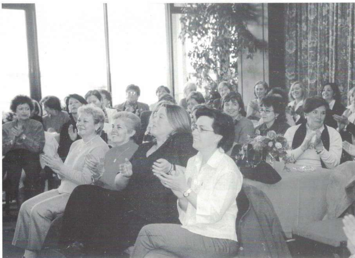
Club Marítimo del Abra. Entrega de diplomas de los cursos de informática.

Y como de costumbre, deciros que estamos a vuestra disposición para cuantas preguntas o sugerencias deseéis formularnos en todo momento.