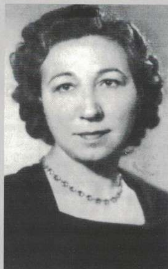
Angela Figuera (Madrid, 1951)

En sus versos encontra- mos tanto la búsqueda de un paraíso más terrenal, como la superación de las injusticias; aspiraciones que siguen vi- gentes hoy en día.