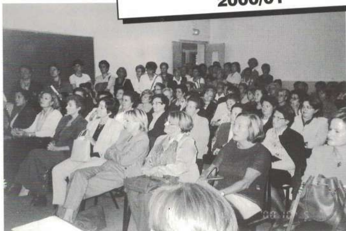
INAUGURACION DEL CURSO 2000/01