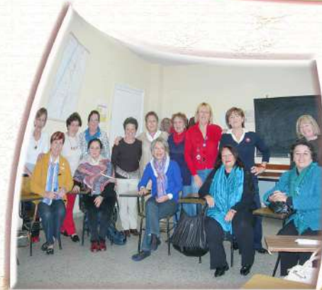
Formación Creatividad Emocional - 2010