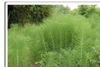
Cola de caballo - Equisetum arvense

Ojalá sean útiles estos simples trucos naturales para quien los necesite, y aprovecho para decirlo que es un verdadero placer para mí colaborar con la revista de Gizatiar.