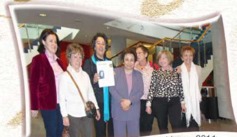
Shirin Ebadi (Premio Nobel) Euskalduna - 2011