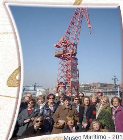
Museo Maritimo - 2012