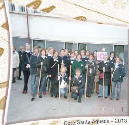
Coro Santa Agueda - 2013