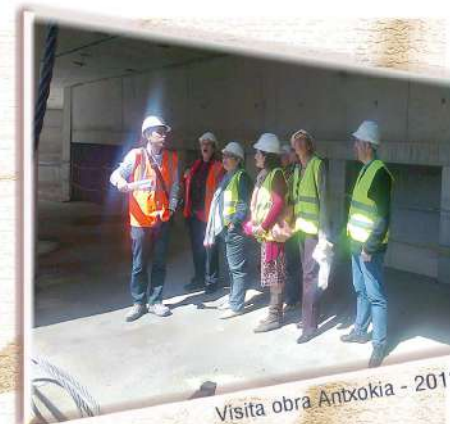
Visita obra Antxokia - 2012