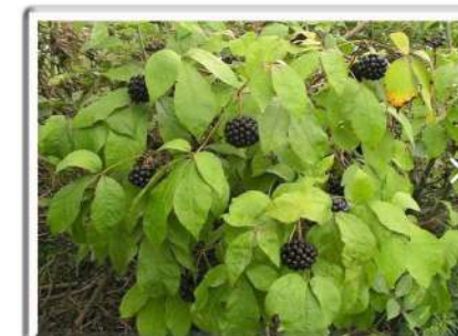
Eleuterococo - Eleutherococcus senticosus