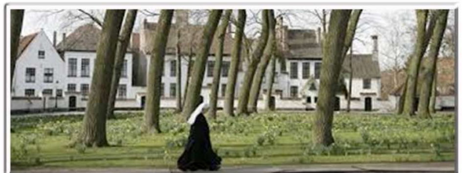
Beguinato de Brujas (Bélgica)