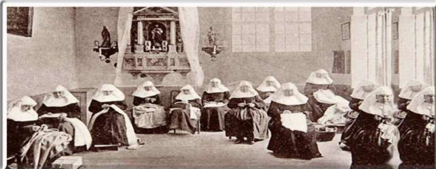
Las monjas beguinas en el trabajo

A FINALES del siglo XII, en la diócesis de Lieja ( Bélgica ), nace un movimiento de mujeres pertenecientes a un amplio espectro social, que deciden buscar lo que se les negaba: el acceso al conocimiento, y a nuevas formas de espiritualidad. Decidieron tomar la palabra para hacer un mundo a su medida. Su forma de vivir y entender la vida se extendió con rapidez por toda Europa Occidental (Francia, Renania, Baviera, Países Bajos, Cataluña...) durante los últimos siglos del Medievo. Hablamos de las beguinas.