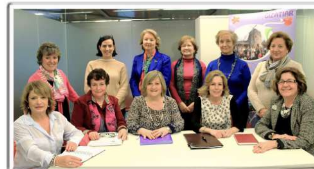
Inauguración curso 2014 / 2015