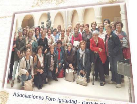
Asociaciones Foro Igualdad - Gazteiz 2014