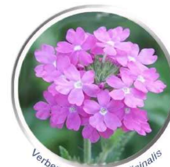
Verbena - Verbena officinalis

Por supuesto estos remedios no sustituyen ningún tratamiento médico.