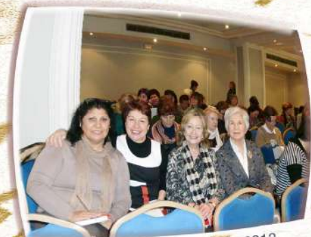
X Aniversario Foro Igualdad - 2012