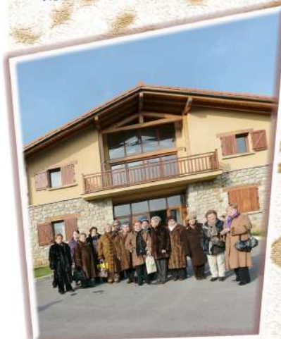
Visita a Derio - 2010