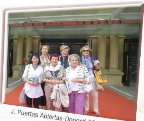
J. Puertas Abiertas-Donosti 2012