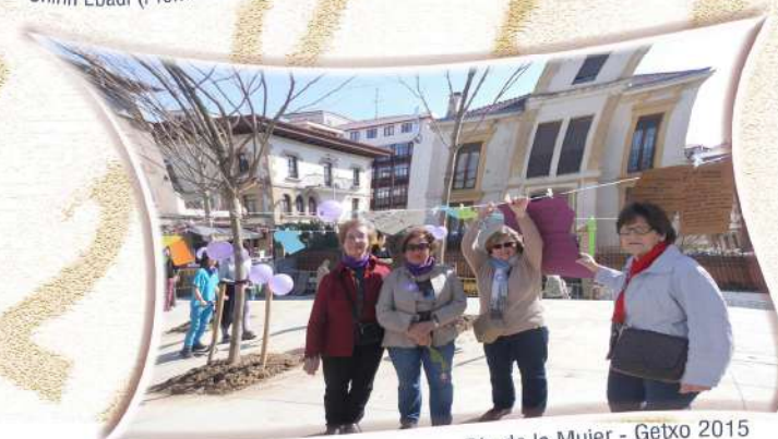
Día de la Mujer - Getxo 2015