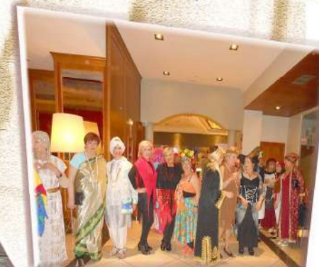
Fiesta de disfraces - Madrid 2014