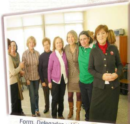
Form. Delegadas y Voluntarias - 2012