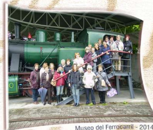
Museo del Ferrocarril - 2014