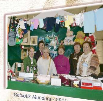
Getxotik Mundura - 2011