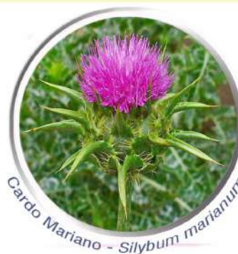
Cardo Mariano - Silybum marianum