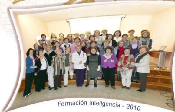
Formación Inteligencia - 2010