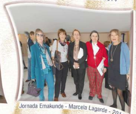
Jornada Emakunde - Marcela Lagarde - 2014