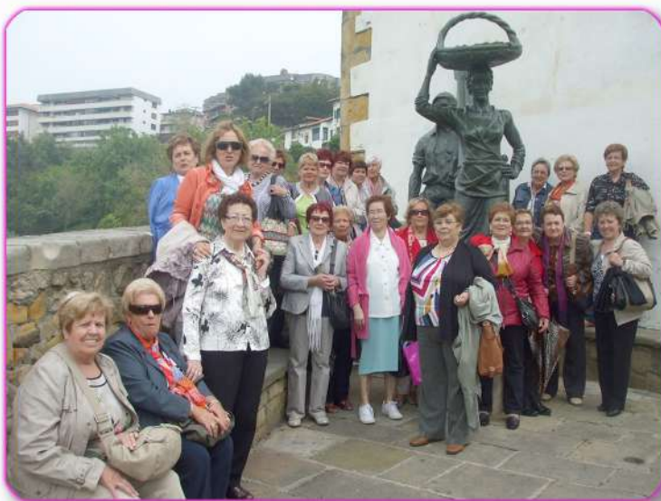
Invitación a la Asociación de Mujeres Santa Ana a visitar nuestro Municipio

La salida de este año a Salinas de Añana, resultó muy interesante y formativa.