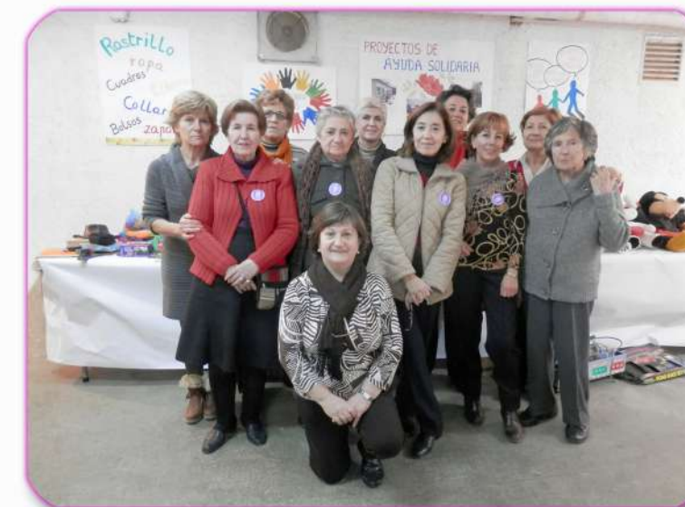
Comisión de Ayuda Solidaria

Los beneficios del Rastrillo y Caja Solidaria (organizado por la Comisión Ayuda Solidaria) generó unos fondos que se han destinado a diferentes proyectos como son: