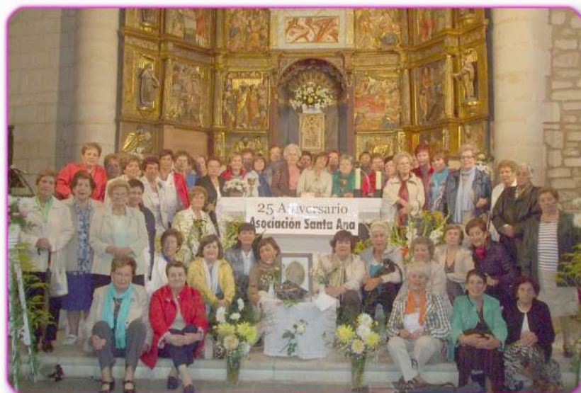
Visita de la Asociación Gizatiar a Salinas de Añana

Como ellas este año celebran el 25 aniversario de su fundación, una representación de Gizatiar asistió como invitada a la celebración del acontecimiento en Salinas.