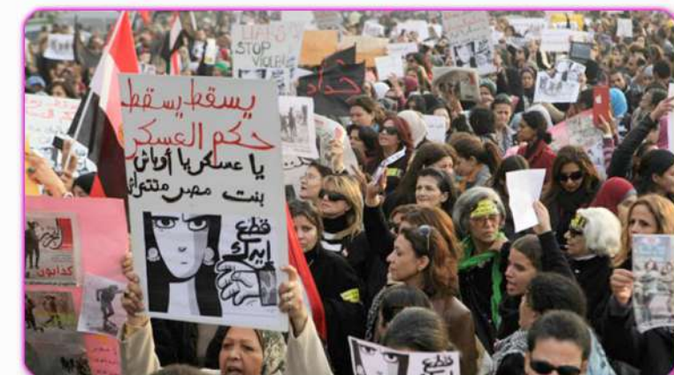
Mujeres egipcias protestan contra las actuaciones del Ejército a manifestantes en la Plaza Tahrir

* Begoña Fernández Aguirre Voluntaria de Gizatiar