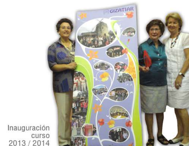
Inauguración curso 2013 / 2014