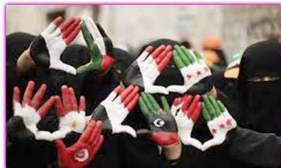
Mujeres yemeníes veladas haciendo el símbolo feminista