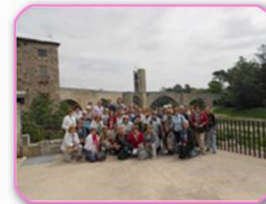
BESALU - Puente Románico

Han sido unos días intensos donde ha primado el buen ambiente y la camaradería.