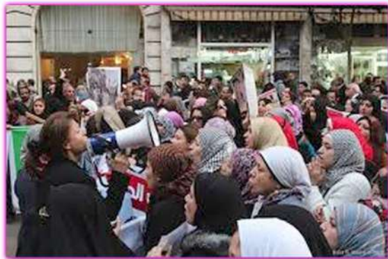
Mujeres tunecinas participando en una concentración

Desde Occidente presenciamos con cierta perplejidad las multitudinarias manifestaciones en Túnez, Egipto, Yemen, Libia... Por primera vez en la historia moderna, el pueblo árabe tomaba la calle y exigía que su voz fuera escuchada. Al grito de Khalas "¡basta ya!" los árabes recuperaban su dignidad. Enseguida empatizamos con quienes exigían libertades democráticas y cambios políticos, económicos y sociales.