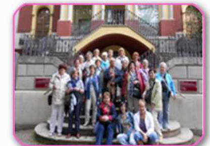
OLOT - Museo de los Volcanes