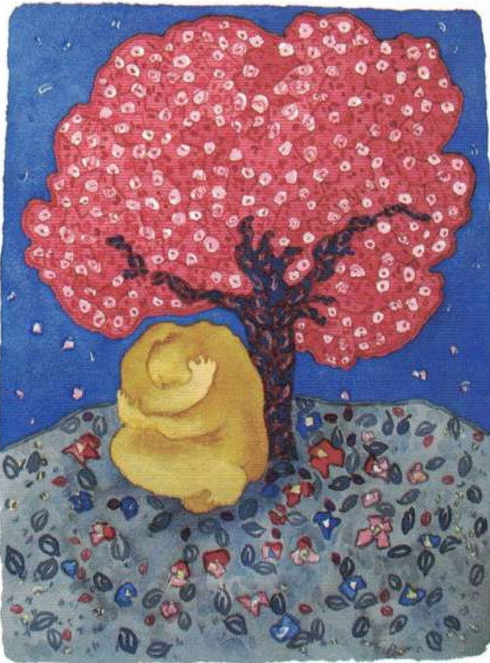
"Sin título" (acuarela)