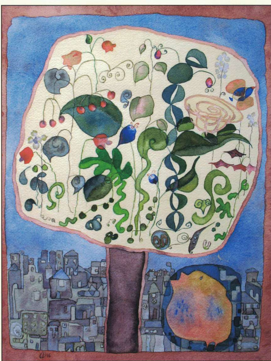
"El nido" (acuarela)