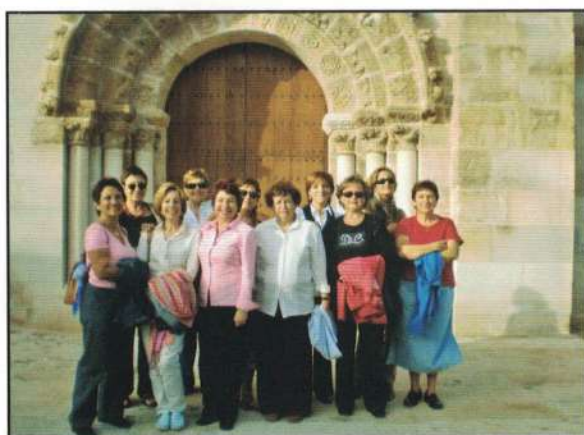
Encuentro con la Asociación Amanecer de Cabanillas (Navarra). Octubre de 2006. Nuestro agradecimiento por un día extraordinario.

No siempre tenemos documentos gráficos de los encuentros que mantiene nuestra asociación con otros grupos de mujeres, pero eso no quiere decir que los momentos vividos no sean estupendos.