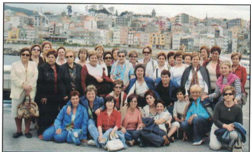
Visita a La Guardia

Desde aquí, queremos hacer llegar nuestro agradecimiento al área de Igualdad de la Concejalía de la Mujer así como a las Asociaciones de Mujeres que con tanto cariño nos atendieron.