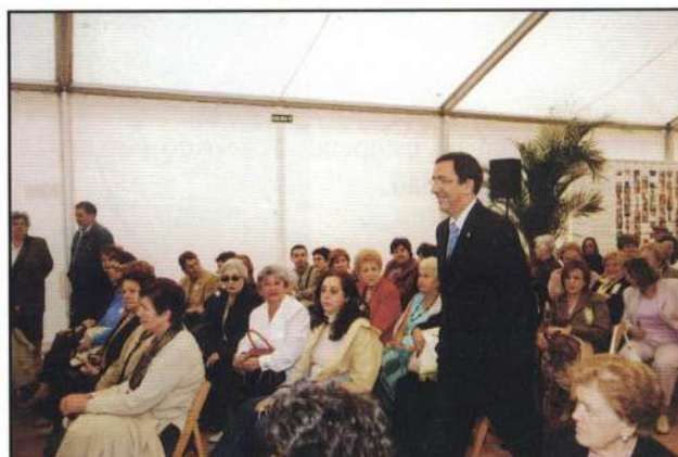
Feria de Asociaciones de Bilbao de 2006