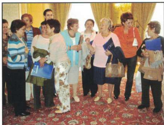
Encuentro con asociaciones de Santiago de Compostela. Mayo de 2006. Nuestro recuerdo a todas por la acogida que nos dispensaron.