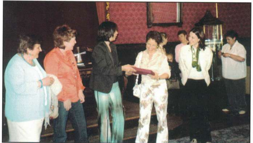
Recepción en el Palacio Rajoy

Galizia besarkada handi batekin hartu zitzaigun