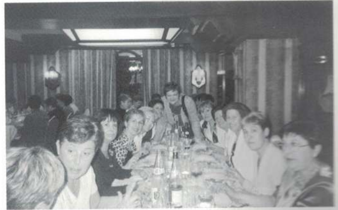
Eskuinean, Iruñako Emekumeen Elkartearekin topaketa. Goian, bazkideen bazkaria.

Arte, comunicación, feminismo, manualidades, salud, viajes, lucha por nuestros derechos y contra la violencia de género, política social, colaboración con entidades, nuevas tecnologías, música, teatro, voluntariado... el listado es largo, pero aún queda mucho por aprender, por hacer, por ofrecer.