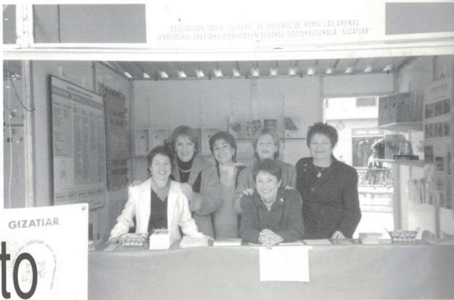
Feria de Asociaciones. Bilbao, 2003.

R elación, formación y solidaridad, éstas son las claves con las que Gizatiar enfrenta su quehacer asociativo. Cada una de ellas se despliega en toda una serie de variadas actividades gestionadas desde las diversas comisiones en que se organiza nuestra entidad. Año tras año desde aquel 1995, la asociación ha ido enriqueciendo el número y la variedad de sus propuestas, siempre pensando en las necesidades