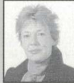
Voc. Instituc. Mª José Valverde