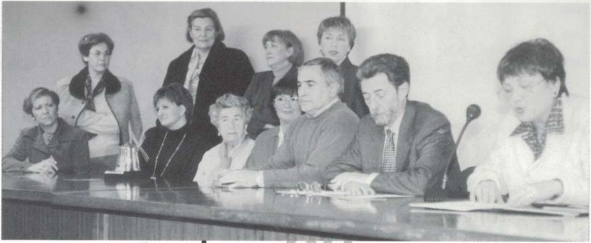
1998, Getxoko Boluntariotzaren Saria.